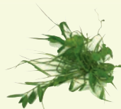
Mauvaises herbes non grainées