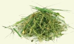
Tontes de pelouse