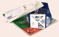
Cartons, revues- magazines, briques alimentaires