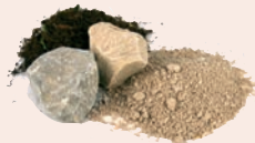
Terre, cailloux, sable