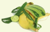
Épluchures de légumes, de fruits, restes de repas