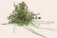
Mauvaises herbes grainées, plantes malades ou traitées