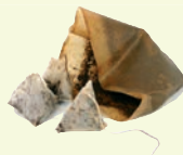
Marc, filtres de café infusettes